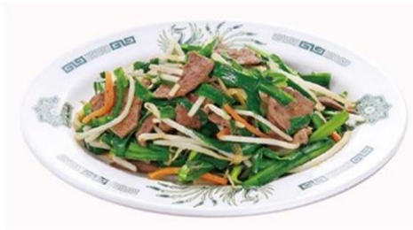
ニラレバ炒め 650 円