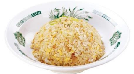
チャーハン 620 円