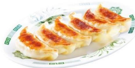
餃子 6 個 300 円