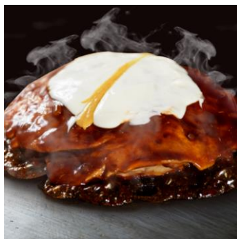
発祥モダン焼 豚入り 1,200円