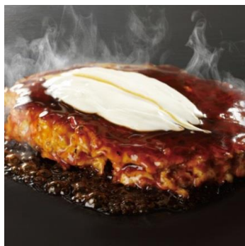
元祖お好み焼 豚玉 1,100円