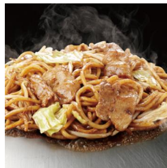
秘伝70年焼そば 豚入り 1,100円