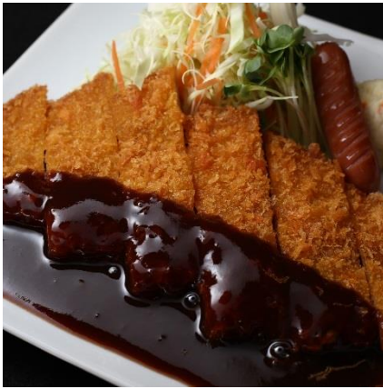
ジャンボとんかつ ごはん付き ¥890 (大盛り無料)