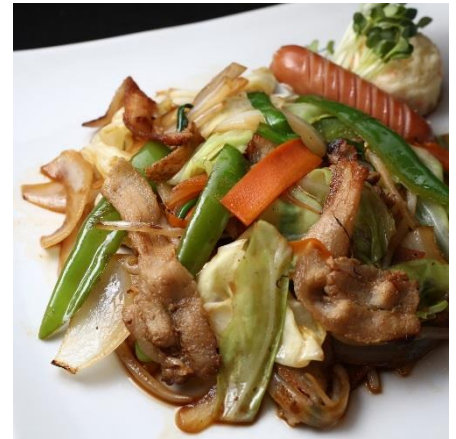
肉野菜炒め ごはん付き ¥790 (大盛り無料)