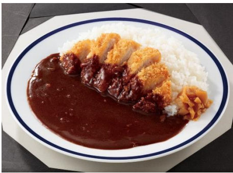
名物のカツカレー