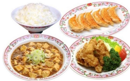
【デラックス】 麻婆豆腐セット 2,030円